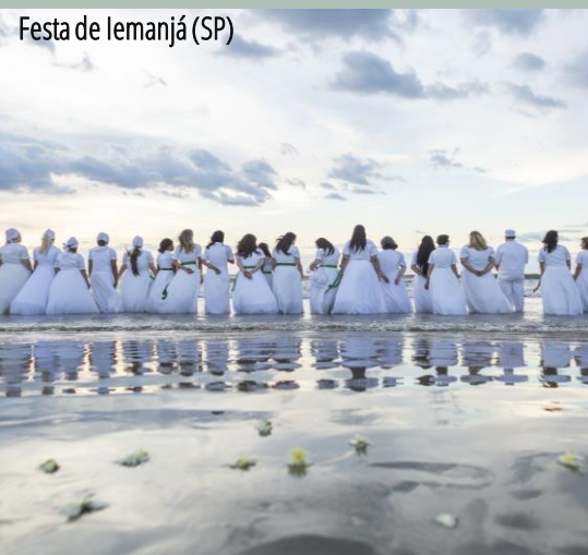
Festa de Iemanjá (SP)

16.b.1 – Proporção da população que reportou ter-se sentido pessoalmente discriminada