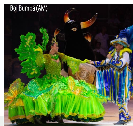
Boi Bumbá (AM)