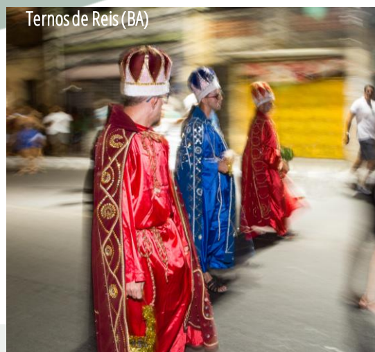
Ternos de Reis (BA)